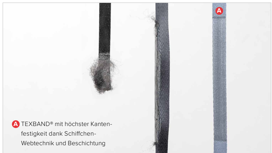
A TEXBAND® mit höchster Kantenfestigkeit dank Schiffchen-Webtechnik und Beschichtung

In Labortests mit Kanten- und Flächenscheuerung erreicht das TEXBAND® bedeutend höhere Standzeiten als Bänder ohne Beschichtung.